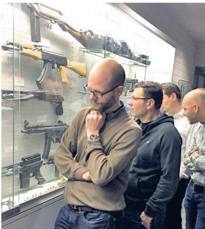
Über Jahrzehnte entstandene, erstaunliche Sammlung an Schuss- und Stichwaffen