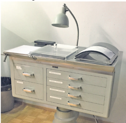
Aus den 40er Jahren stammende und noch immer dienst verrichtender Apparat zur Aufzeichnung von Fingerabdrücken